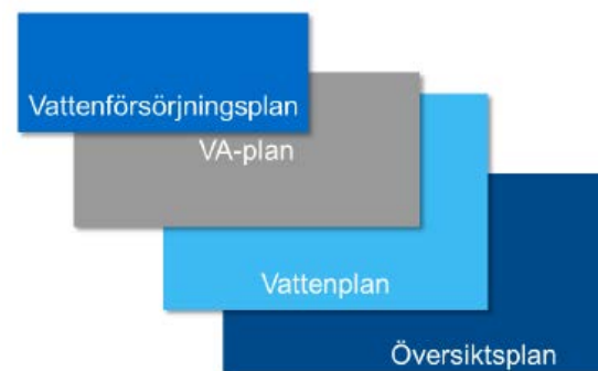
Figur 3. Principiell bild som visar hur översiktsplan, vattenplan, VA-plan respektive vattenförsörjningsplan kan förhålla sig till varandra.