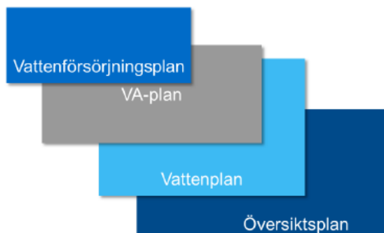
Figur 3. Bilden hämtad från Havs- och vattenmyndighetens vägledning om kommunal VA-planering (rapport 2014:1). Principiell bild som visar hur översiktsplan, vattenplan, VA-plan respektive vattenförsörjningsplan kan förhålla sig till varandra.